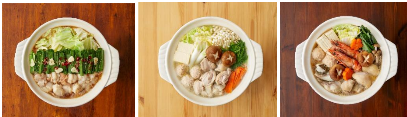
▲ (左から) 濃縮鍋スープ「うまいのもと もつ鍋」「うまいのもと 鶏白湯鍋」「うまいのもと 寄せ鍋」